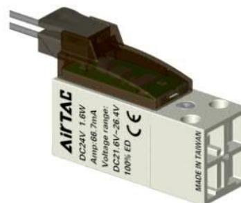
平行插接式 (端子线与阀体平行)