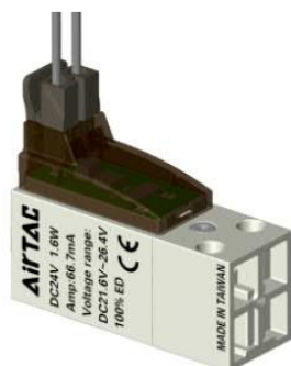
垂直插接式 (端子线与阀体垂直)